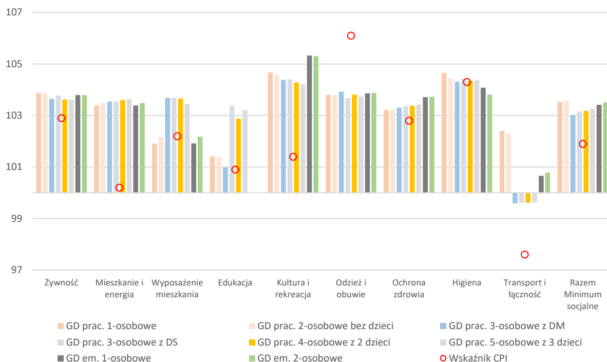
Wykres 2. Zmiana wartości minimum socjalnego w II kwartale 2023 r. na tle inflacji (I kwartał 2023 r. = 100)

Symbole: GD – gospodarstwo domowe, GD prac. – pracownicze gospodarstwo domowe, GD em. - emeryckie gospodarstwo domowe, DM – dziecko młodsze w wieku 4-6 lat, DS – dziecko starsze w wieku 13-15 lat.